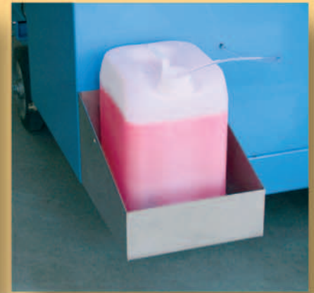
Konsole für Reinigungsmittel (optional).