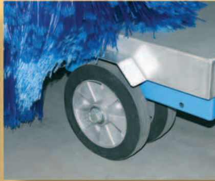
Doppelräder für hohe Stabilität.