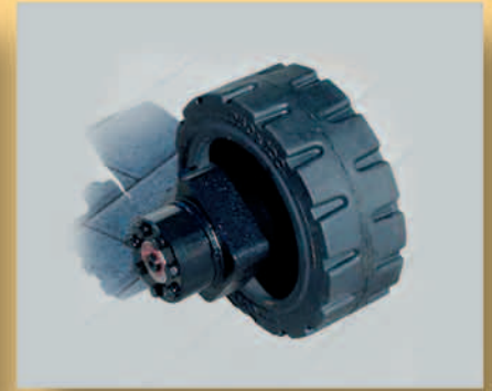
Hydraulikantrieb für stufenlosen antrieb mit extra großem Rad.